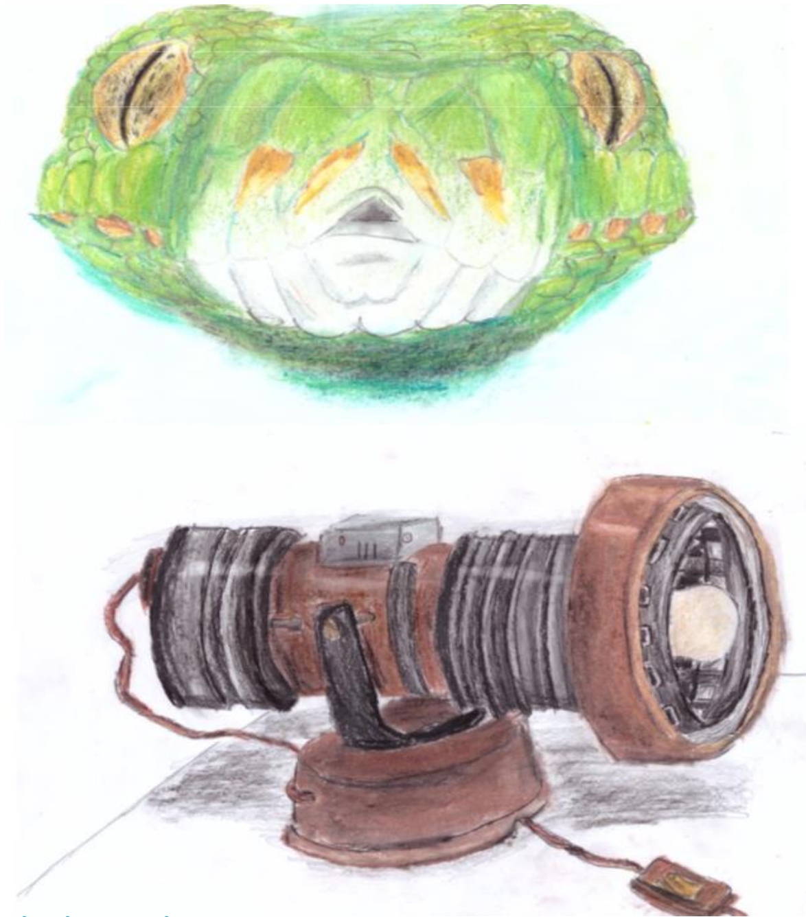
KÍGYÓ PORTRÉ BALATONI LÁMPA

Új rovatunkban családi művészeink alkotásait mutatjuk be. Elsőként Bazsi két művét tesszük közzé.